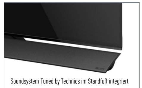
Soundsystem Tuned by Technics im Standfuß integriert